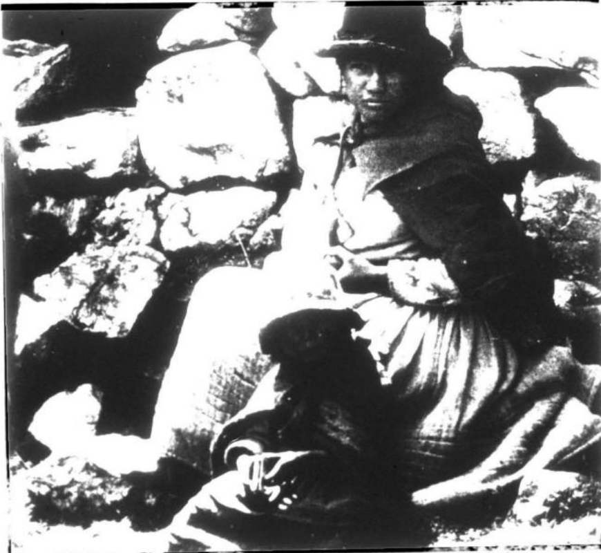
El campesinado, principalmente el pobre es el que conforma la inmensa mayoría

¿Por qué es semicolonial? El Presidente Gonzalo nos enseña que la economía peruana moderna nace subyugada por el imperialismo, fase final del capitalismo caracterizado magistralmente como monopolista, parasitario y agonizante; imperialismo que si bien consiente nuestra independencia política, según sirva a sus intereses, controla todo el proceso eco-