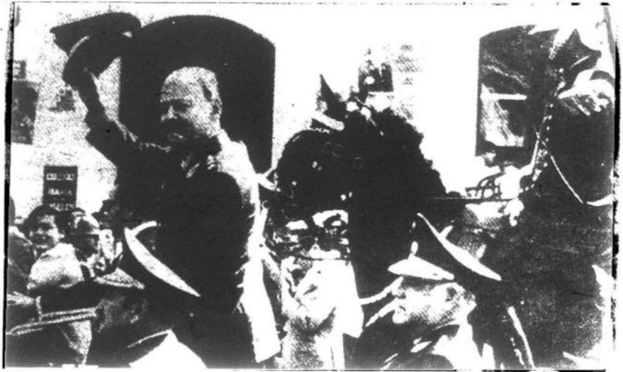
Con la ley 17716 de reforma agraria, Velasco Alvarado desarrolló la gran propiedad asociativa, fomentando a la par el capitalismo burocrático.

Así establece el carácter de la sociedad peruana semi-feudal, semicolonial sobre la cual se desenvuelve un capitalismo burocrático, fija los blancos de la revolución, las tareas a emprender, define las clases sociales y plantea la esencia de la revolución democrática y también cómo se concreta hoy y su perspectiva.