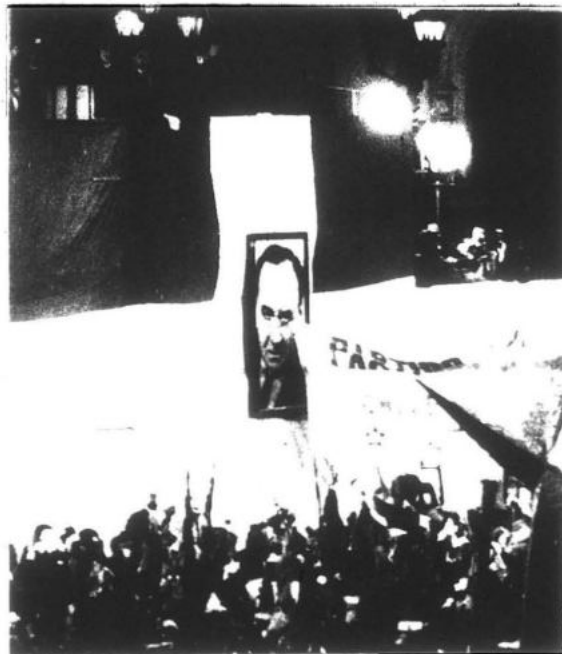
Al igual que sus antecesores, García Pérez trata de llegar al pueblo a través de su caduca demagogia.

Así el Presidente Gonzalo nos plantea: "¿Esta revolución democrática qué es en esencia? es guerra campesina dirigida por el Partido