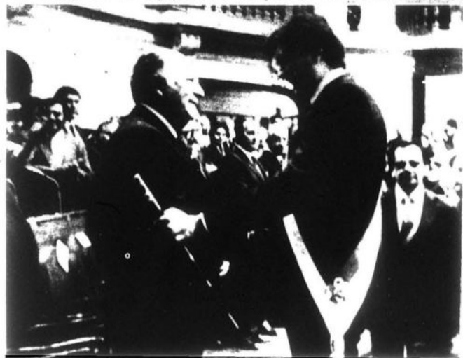
Estado reaccionario en el Perú es del primer tipo, de dictadura conjunta de terratenientes y grandes burgueses, burocráticos o compradores que

¿Qué tipo de Estado sostiene esta sociedad semi-feudal y semicolonial sobre la que se desenvuelve un capitalismo burocrático? Habiendo analizado la sociedad peruana contemporánea, basándose en la magistral tesis maoísta "Sobre la Nueva Democracia" que plantea que los múltiples sistemas de Estado en el mundo pueden reducirse a tres tipos fundamentales, según su carácter de clase: 1) república bajo la dictadura de la burguesía, lo constituyen también los Estados de vieja democracia y pueden incluirse los Estados bajo dictadura conjunta de terratenientes y gran burguesía; 2) república bajo la dictadura del proletariado; y 3) república bajo la dictadura conjunta de las clases revolucionarias. El Presidente Gonzalo establece que el carácter del viejo