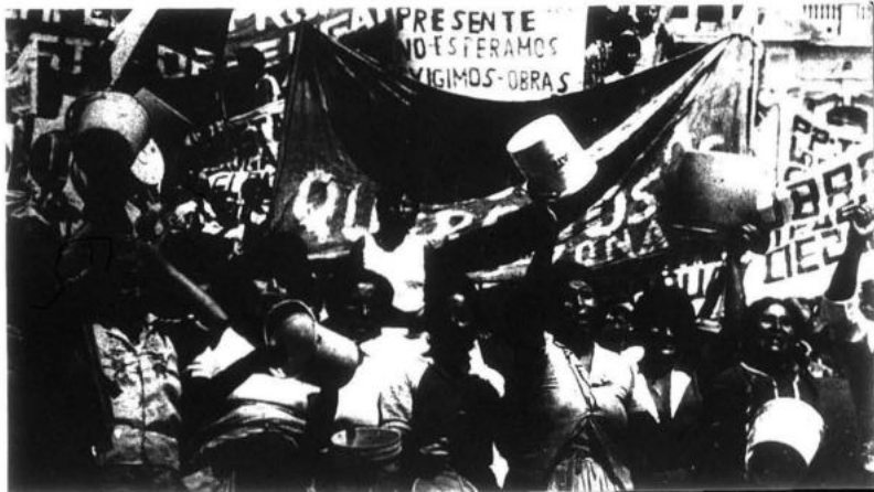
Campeños emigrantes en la capital, sufren la opresión del capitalismo burocrático.

... aplica una forma más suave de dominio y lo derivó a la caracterización de "país dependiente". Luego, aplicando la tesis del Presidente Mao de que se abre un período de lucha contra las dos superpotencias que pugnan por repartirse el mundo y que hay que especificar el enemigo principal del momento, define que el imperialismo principal que nos domina es el imperialismo yanqui pero afirma, que hay que conjugar al socialimperialismo ruso que cada día penetra más en el país, como también