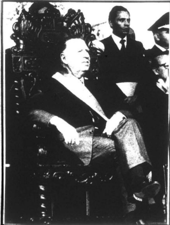
Con Belaunde en el poder, el capitalismo burocrático entra en crisis general y a su destrucción final. Se inicia la guerra popular.

"El marxismo-leninismo-maoísmo, pensamiento Gonzalo sobre capitalismo burocrático, es un aporte a la revolución mundial"