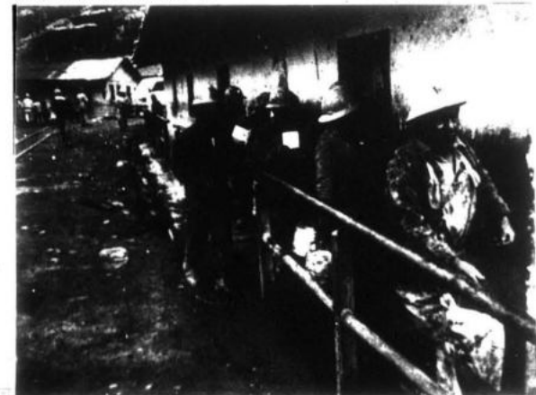
Mineros rumbo a los socavones, donde sufren la peor explotación.