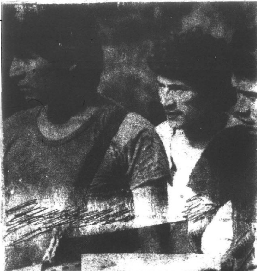
Las masas están organizadas plasmándose su movilización, politización, organización y armamento.