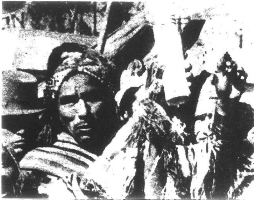
El campesinado pobre constituye el 60% de la población que durante siglos trabaja la tierra pero están atados a la propiedad y a la servidumbre.

Esta condición aplasta al campesinado en un sistema de servidumbre que como