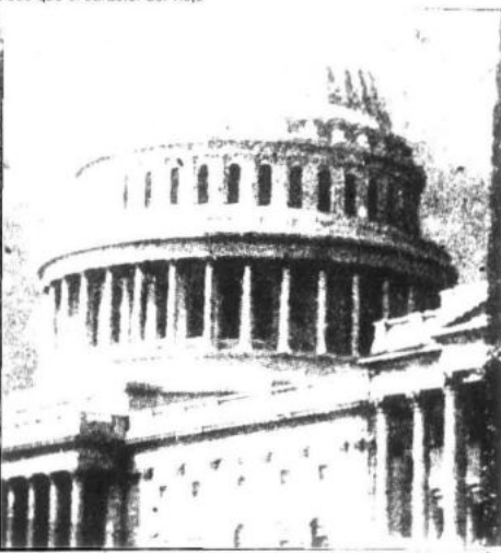
El imperialismo yanqui desenvuelve el capitalismo burocrático en países como el nuestro, semi-coloniales y semi-feudales.

El imperialismo, para nosotros el yanqui principalmente porque es el imperialismo prin-