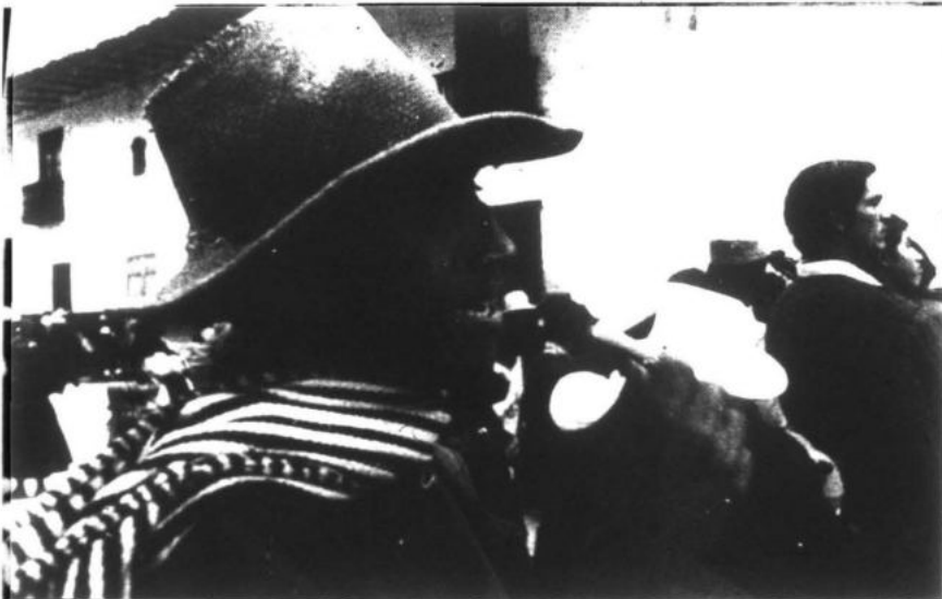
El campesinado unido al proletariado conforma la alianza obrera campesina base del Frente.

... el campesinado fuerza motriz principal..."