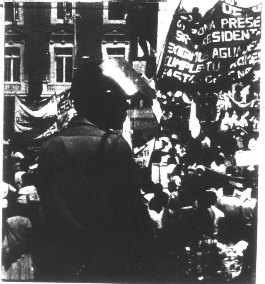
En su lucha diaria, los trabajadores marchan hacia su principal meta, la toma del Poder.

El proletariado peruano en sus últimas luchas viene plasmando el resistir y combatir