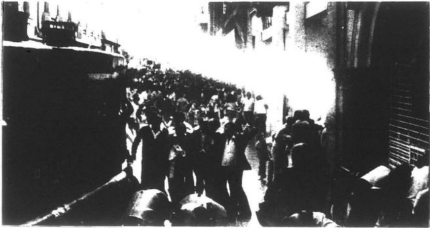
... el proletariado...clase dirigente de nuestra revolución".

El Presidente Gonzalo nos enseña que la revolución democrática es indispensable, primera etapa en las naciones oprimidas la que atravesará diversos períodos según se resuelvan las contradicciones. Concibe una relación indisoluble y un camino ininterrumpido entre revolución democrática y la segunda etapa que es la revolución socialista y su perspectiva es una serie de revoluciones culturales para llegar al Comunismo sirviendo a la revolución mundial. Por tanto, cumplimos un programa máximo y uno mínimo, el mínimo es el programa de la revolución democrática que va especificándose en cada período y que implica una nueva política: dictadura conjunta de cuatro clases; nueva economía: confiscación del gran capital imperialista, del capitalismo burocrático y de la gran propiedad terrateniente feudal y entrega individual de tierra a los campesinos pobres principalmente; nueva cultura: nacional o sea antiimperialista, democrática o sea para el pueblo y científica esto es basado en la ideología del marxismo-leninismo-maoísmo, pensa-