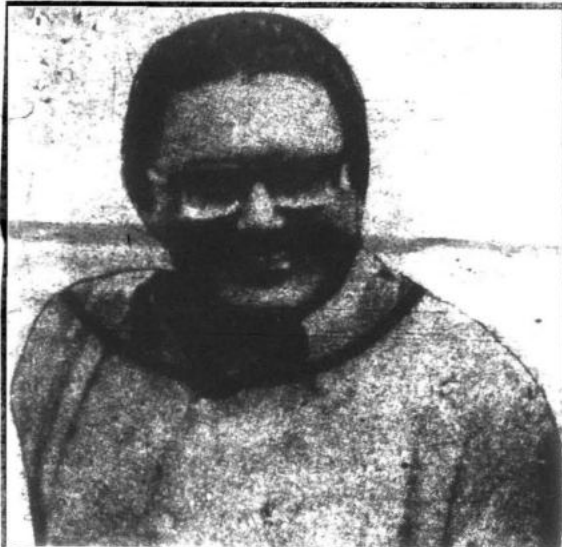
"El presidente Gonzalo establece que la revolución peruana en su curso histórico ha de ser primero revolución democrática".