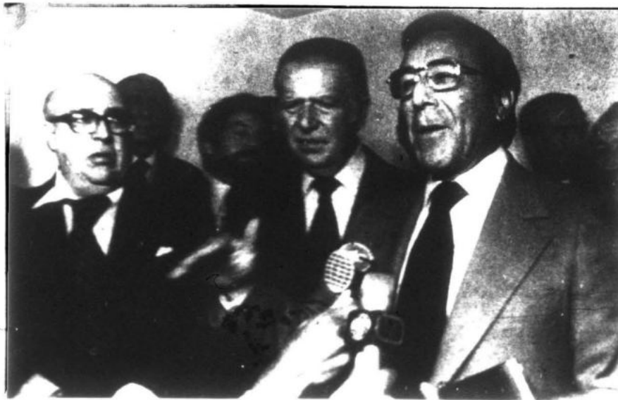
En el proceso histórico de nuestro país no ha habido una revolución burguesa ya que no hubo una burguesía capaz de conducirla.

Al mismo tiempo plantea que la sociedad peruana contemporánea está en crisis general, enferma, grave, in-