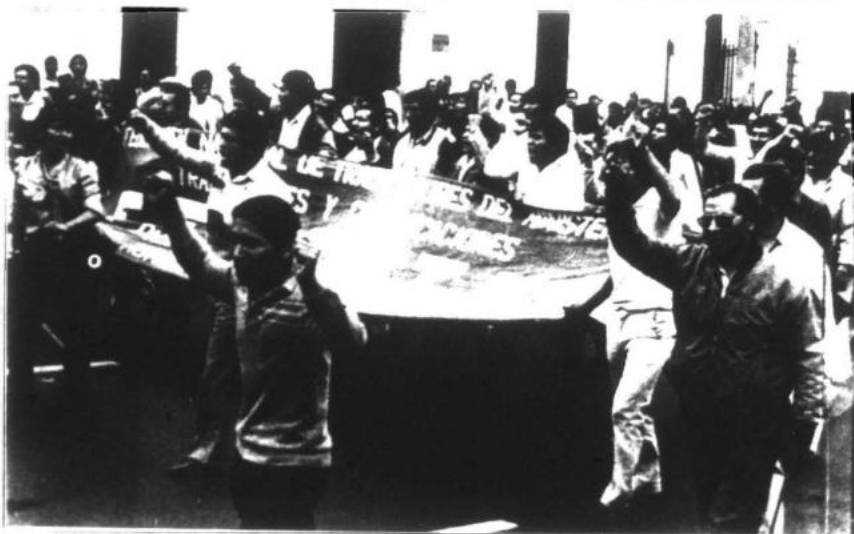
El proletariado, clase dirigente de la revolución que en sus diarias luchas arranca mendrugos salariales y conquistas a sus explotadores.

De particular importancia a la organización científica de la pobreza, tesis que viene desde Marx y que para nosotros